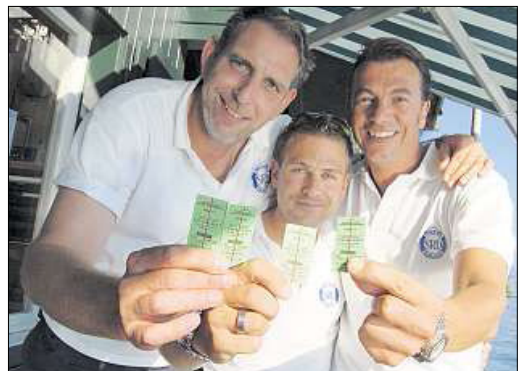
Der Flaschenfund bescherte Erstklass-Freifahrten mit Kursschiffen. (Frank Speidel)