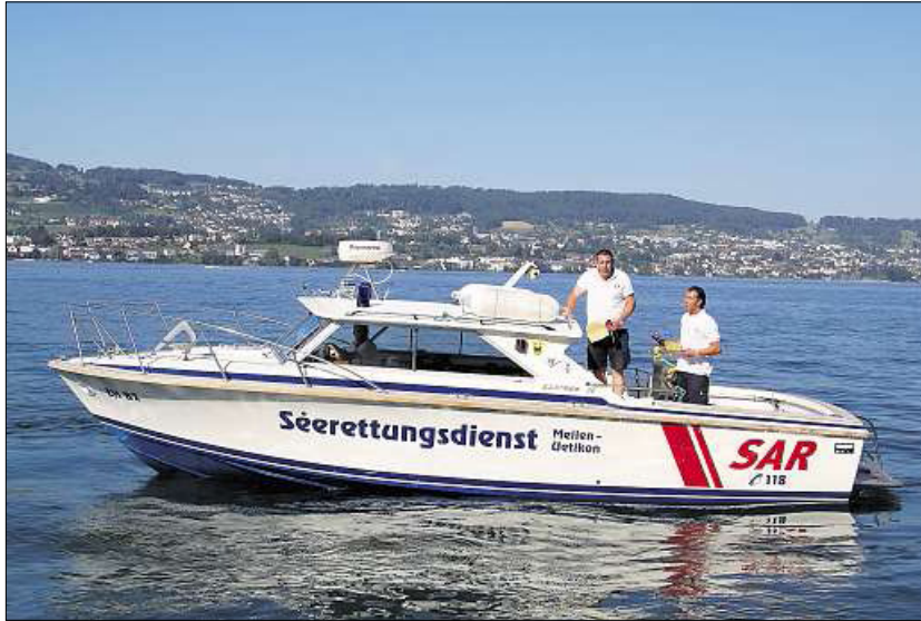
An dieser Stelle vor der Halbinsel Au fanden die Seeretter eine der Flaschen. (Frank Spiedel)