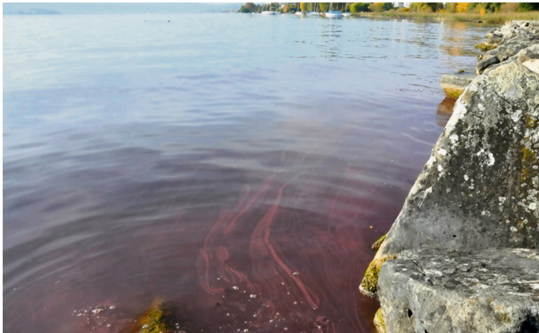
Ein Phänomen, das künftig noch stärker auftreten dürfte: Burgunderblutalgen treiben gut sichtbar an der Wasseroberfläche im Zürichsee.

Die Burgunderblutalge ist trotz ihres Namens keine Alge, sondern ein Bakterium. Jeweils im Sommer wächst es in einer Wassertiefe von etwa 10 bis 12 Metern heran. Wenn sich das Seewasser dann in den Herbst- und Wintermonaten abkühlt und sich die Wassermassen durchmischen, sinken die Algen in tieferes Wasser und sterben ab. Die Überreste steigen dann mit der Zirkulation teils wieder an die Oberfläche auf. Was man also derzeit mit blossen Auge im See erkennen kann, ist ein Leichentepich.