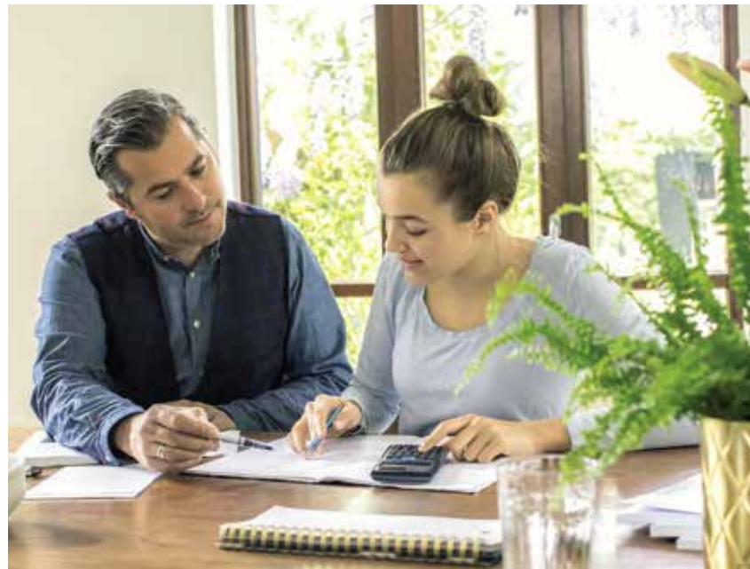
Individuelle Nachhilfe bringt am meisten.

Abacus-Nachhilfe bietet seit Jahren Nachhilfeunterricht an, auch in den Schulferien. Gerade während der Ferien kann man gezielt Stoff in den verschiedenen Fächern wie z.B. Mathematik oder Sprachen wiederholen und vertiefen, ohne dass neue Themen hinzukommen. Die Ter-